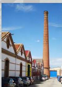
AZUCARERA SAN JOSÉ Antequera